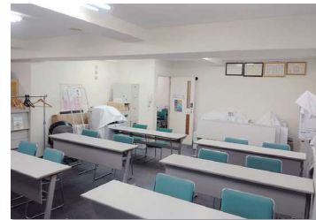
▲入口の対角線上から