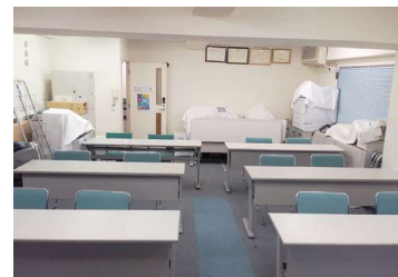
▲教室前方中央から