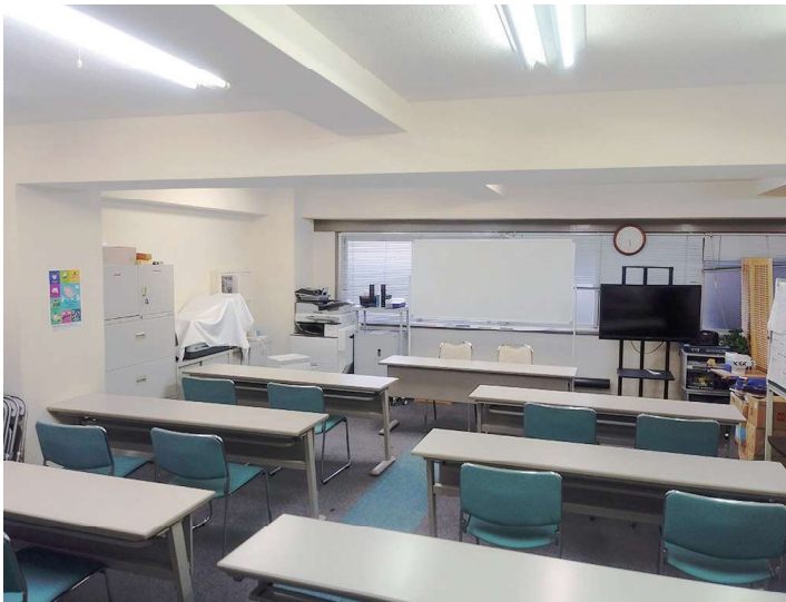
▲教室後方入口から